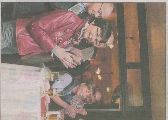
Applaus gab es für viele gute Bands, die große Anziehungskraft hatten.

Denn genau das macht den Reiz und die Atmosphä- re der Jazz- und Blusenacht aus. Auch am vergangenen