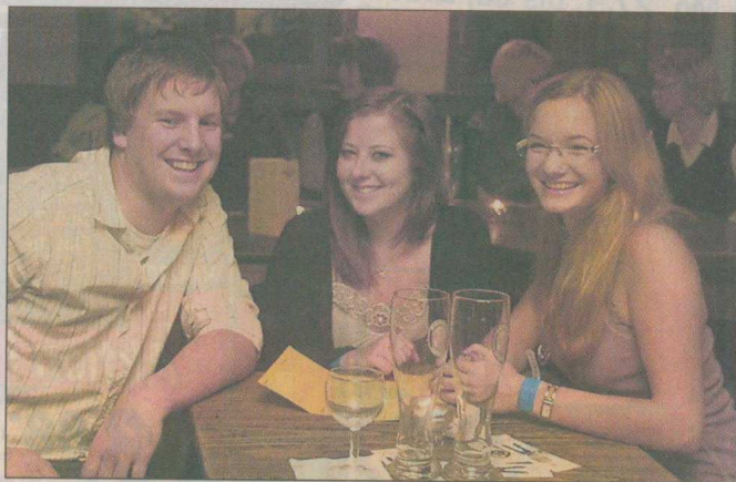
Vor allem im Portofino, aber auch anderswo fühlten sich die jungen Blues-Nacht-Besucher musikalisch gut aufgehoben.