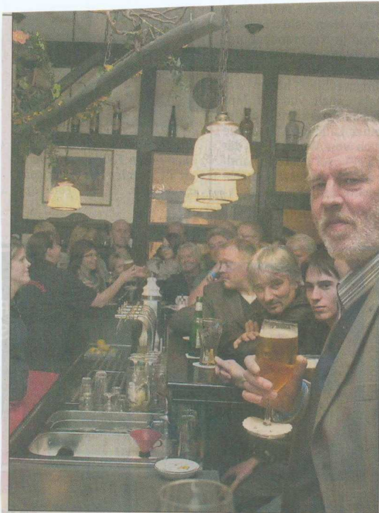
In jeder Kneipe traf man auf Gleichgesinnte.